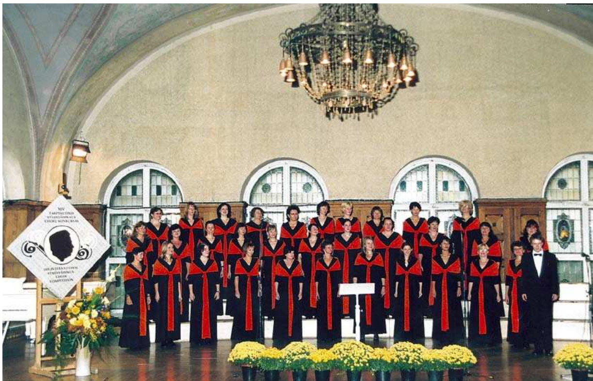
Foersterovo pěvecké komorní sdružení