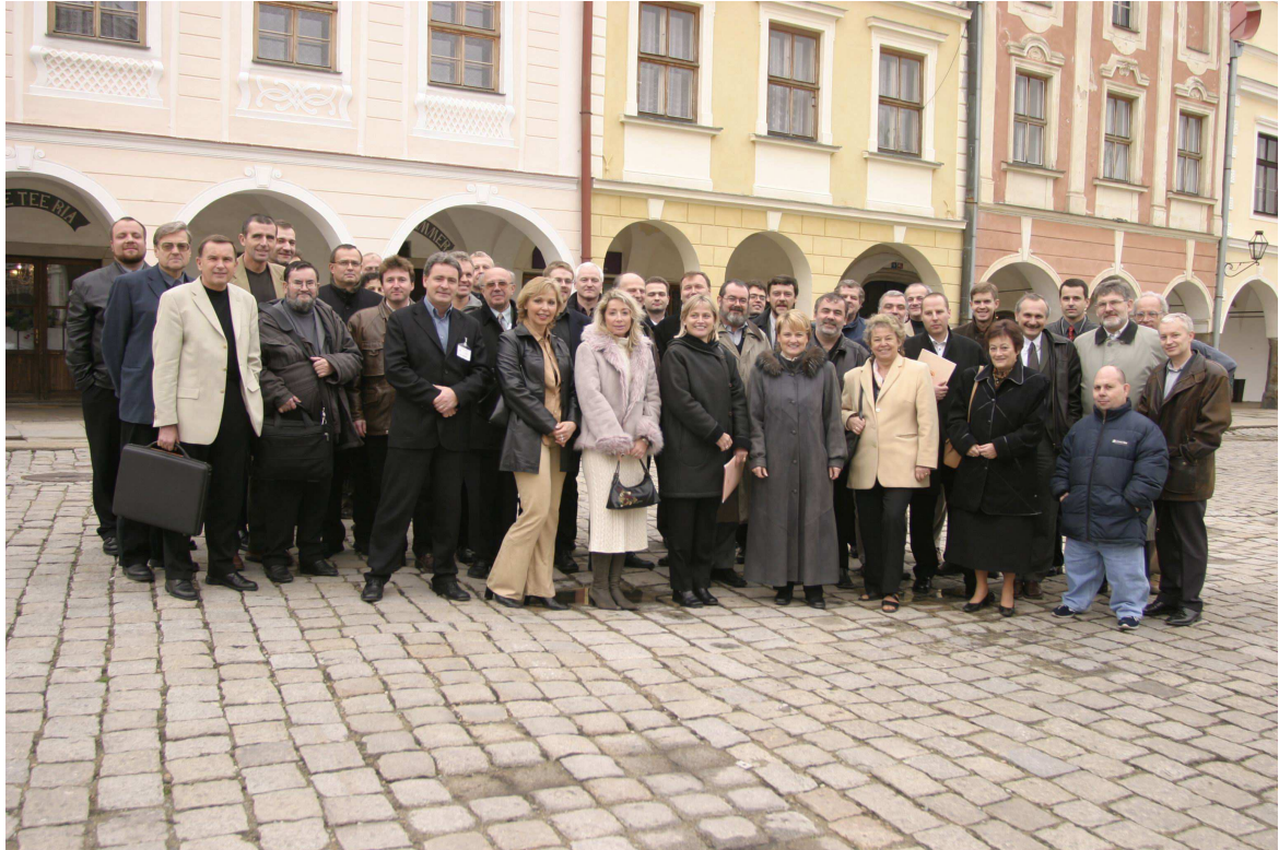
- listopad. 2003 Telč, DRG (viz foto)